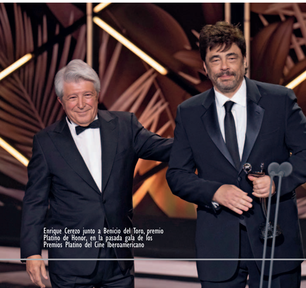
Enrique Cerezo junto a Benicio del Toro, premio Platino de Honor, en la pasada gala de los Premios Platino del Cine Iberoamericano

Enrique Cerezo no necesita presentaciones. Todo el mundo conoce a este productor y distribuidor audiovisual, presidente del Atlético de Madrid y convertido hoy en el gran conservador del cine español. Su compromiso multifacético con la industria audiovisual lo articula a través de las empresas e instituciones que dirige y sus respectivas actividades: Enrique Cerezo Producciones, Video Mercury, canal 8Madrid y FlixOlé. También preside EGEDA -entidad de gestión sin ánimo de lucro que defiende y gestiona los derechos de propiedad intelectual de las productoras españolas- desde donde se impulsan actividades tan importantes para el sector como Iberseries & Platino Industria -el evento referente internacional de la producción de habla hispana y portuguesa- o los Premios Cinematográficos José María Forqué. ↳