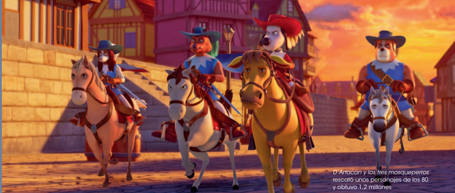
D'Artacan y los tres mosqueperros rescató unos personajes de los 80 y obtuvo 1,2 millones