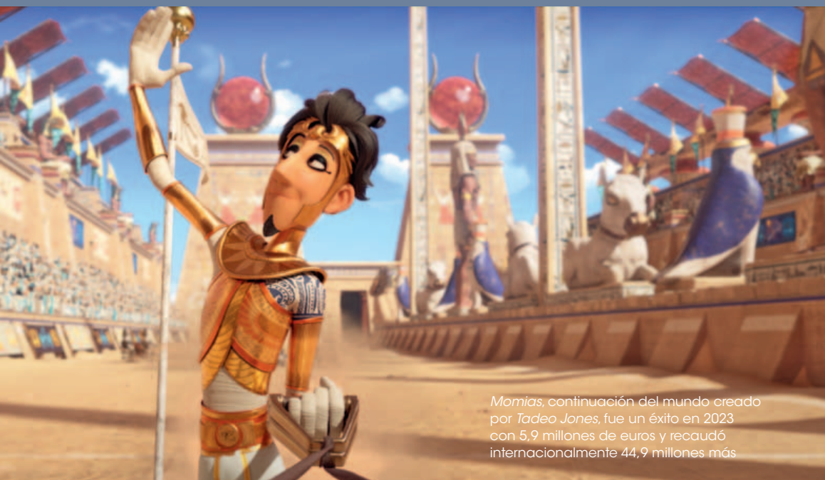
Momias , continuación del mundo creado por Tadeo Jones, fue un éxito en 2023 con 5,9 millones de euros y recaudó internacionalmente 44,9 millones más

considerablemente más alto que el de una película de imagen real. Veamos, por ejemplo, el caso de las películas de animación españolas más exitosas del siglo XXI, Las aventuras de Tadeo Jones (18,2 millones recaudados en 2012) y sus secuelas, El secreto del Rey Midas (17,6 millones en 2017) y La tabla esmeralda (11,5 millones en 2022).