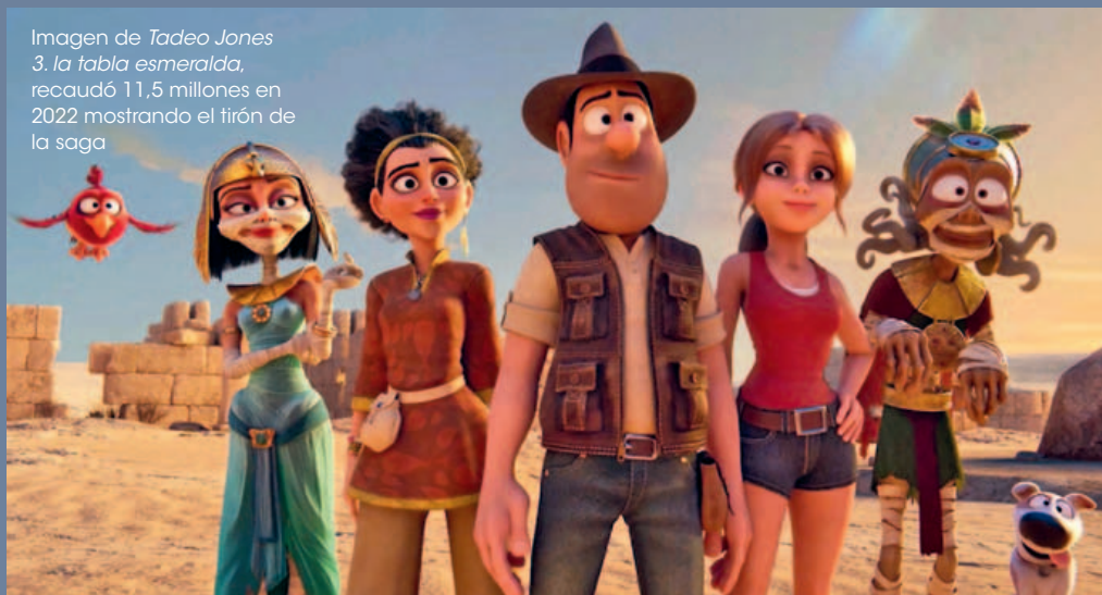
Imagen de Tadeo Jones 3. La tabla esmeralda , recaudó 11,5 millones en 2022 mostrando el tirón de la saga

A la hora de rentabilizar inversiones tan elevadas, Hollywood no solo cuenta con los réditos en taquilla ya que los beneficios se multiplican a través de videojuegos, juguetes o menús infantiles especiales para las grandes cadenas de comida rápida. Tadeo Jones , al igual que lo hacen las grandes producciones de Pixar o Disney, ha sa- ➤