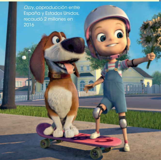
Ozzy, coproducción entre España y Estados Unidos, recaudó 2 millones en 2016

De las tres productoras de cine de animación españolas llamadas a revolucionar la industria cinematográfica hace 20 años, ninguna de ellas existe. Ese momento de esplendor se radica sobre todo en Galicia, donde florecen dos estudios de gran potencial. Por una parte, Filmax Animation, en asociación con Bren Entertainment, durante la primera década del milenio toma velocidad de crucero y estrena una película cada dos años siguiendo un ritmo plenamente industrial. De forma seguida, estrena películas como El ladrón de sueños (100 mil euros en 1999); El Cid, la leyenda (2,6 millones en 2003) o Gisaku (100 mil euros en 2005), con resultados desiguales como puede comprobarse. La compañía se marca un éxito de taquilla con Pérez, el ratoncito de los sueños (3,7 millones en 2006), en coproducción con Argentina, pero el fracaso de la ambiciosa Donkey Xote (1,3 millones en 2007) y Copito de nieve (1,6 millones en 2011) abocan a la compañía al cierre. También radicada en Galicia, la ambiciosa productora Dygra irrumpió con fuerza en 2001 con el estreno de El bosque animado , la primera película en animación 3D de Europa con una taquilla de 1,9 millones.