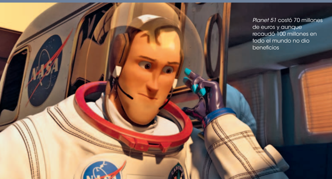
Planet 51 costó 70 millones de euros y aunque recaudó 100 millones en todo el mundo no dio beneficios

En un país como el nuestro que no cuenta con unos niveles de producción tan elevados como Estados Unidos, Francia o Reino Unido, el cine de animación presenta un gran reto, ya que los procesos de creación son largos y requieren de un presupuesto