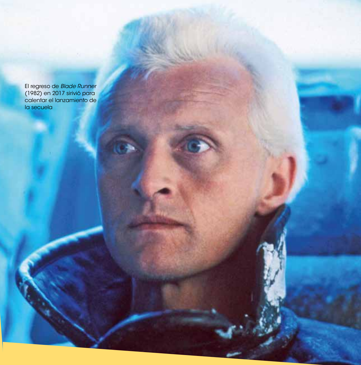
El regreso de Blade Runner (1982) en 2017 sirvió para calentar el lanzamiento de la secuela