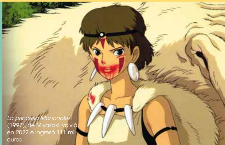
La princesa Mononoke (1997), de Miyazaki, volvió en 2022 e ingresó 111 mil euros

Los exhibidores han sabido también generar eso que tanto se busca con las grandes películas, esto es, el “efecto evento”. Y por eso no solo se programan ciclos de reconocidos cineastas, sino que se acompañan las proyecciones de coloquios y presentaciones con expertos o profesionales del sector. La idea es siempre que el público encuentre en la sala “algo más” que la mera reproducción de una película. También, desde los departamentos de marketing , han sabido llegar a las comunidades más fanáticas de sagas que hacen de ir al cine un acto social. Así, los fan events no solo sirven para ven-