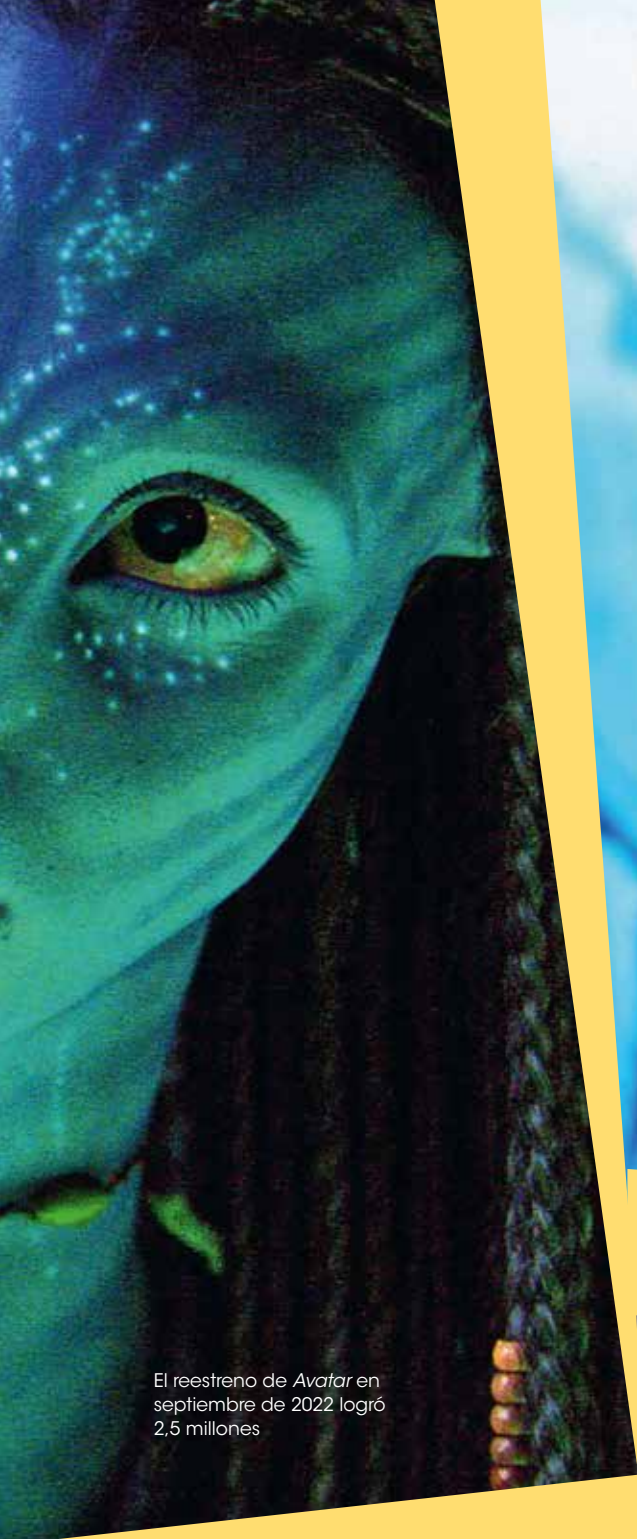
El reestreno de Avatar en septiembre de 2022 logró 2,5 millones