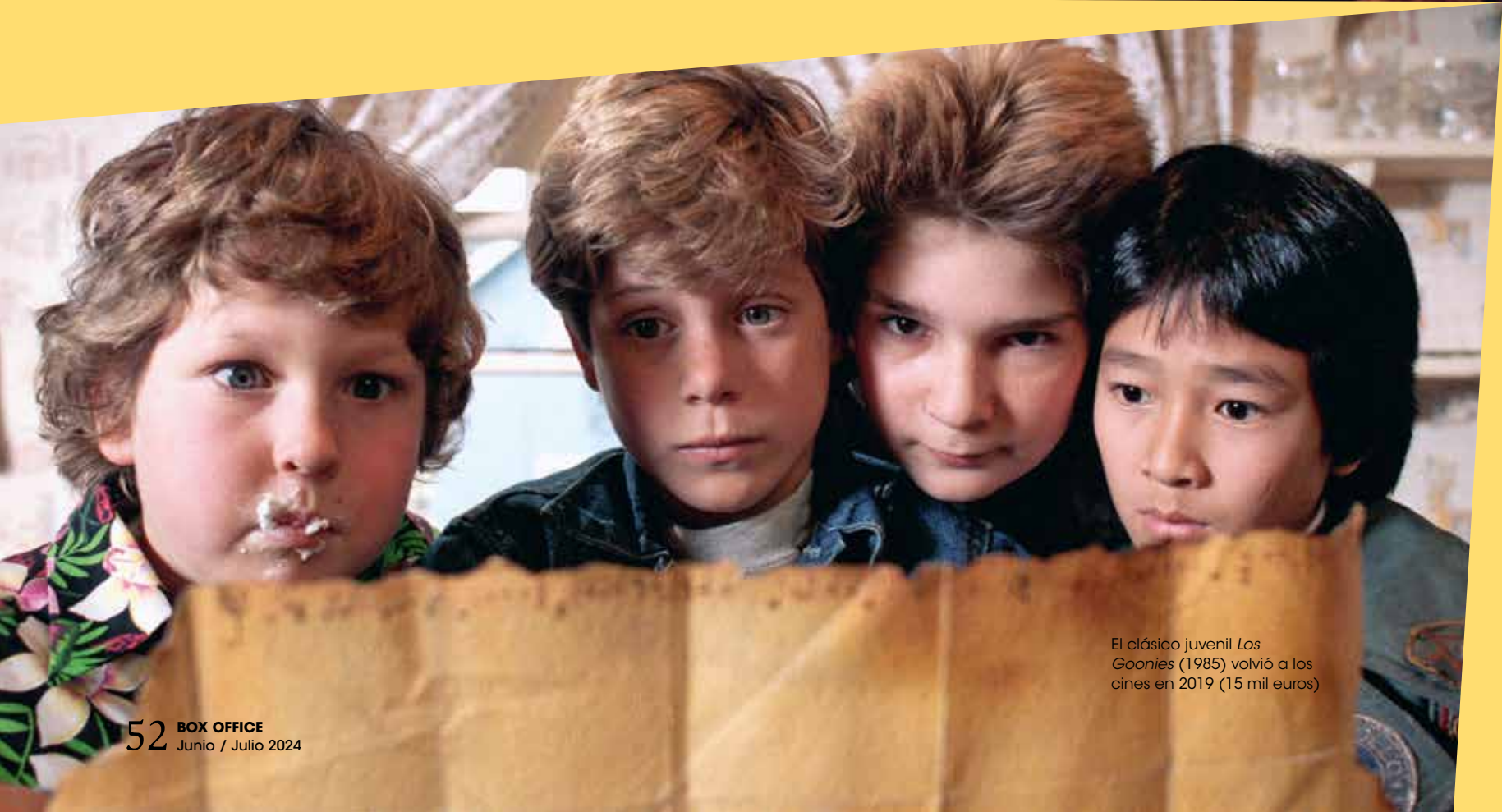
El clásico juvenil Los Goonies (1985) volvió a los cines en 2019 (15 mil euros)