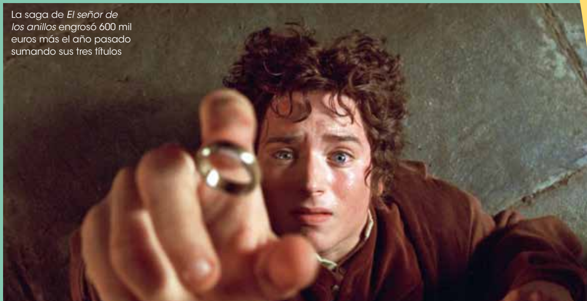
La saga de El señor de los anillos engrosó 600 mil euros más el año pasado sumando sus tres títulos

evento cuenta con un coloquio posterior con especialistas del sector. Una oferta similar tiene MK2. Son sus 'mk2 Clásic', que cada martes ofrece una cita con títulos como La dama de Shangai , Dos hombres y un destino , Chinatown , El verdugo y otros tantos que siempre aparecen en las listas de 'Lo que deberías ver antes de morir'. Yelmo, por su parte, oferta dentro de sus eventos + Que Cine en contadas ocasiones reposiciones imprescindibles. Además, tanto los cines de verano como salas de instituciones como la Berlanga de Madrid (que pertenece a la SGAE) programan ciclos de clásicos con frecuencia, al igual que las Cinetecas de todo el territorio.