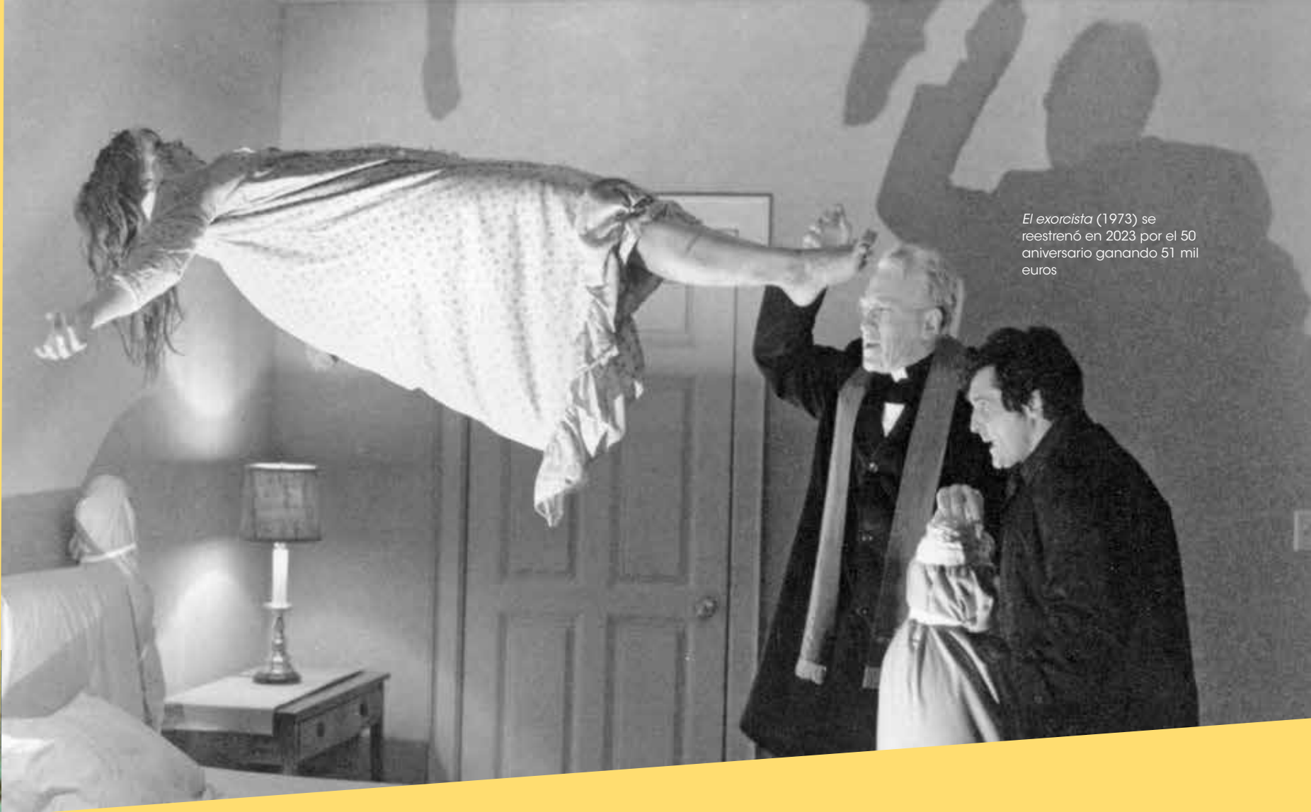
El exorcista (1973) se reestrenó en 2023 por el 50 aniversario ganando 51 mil euros